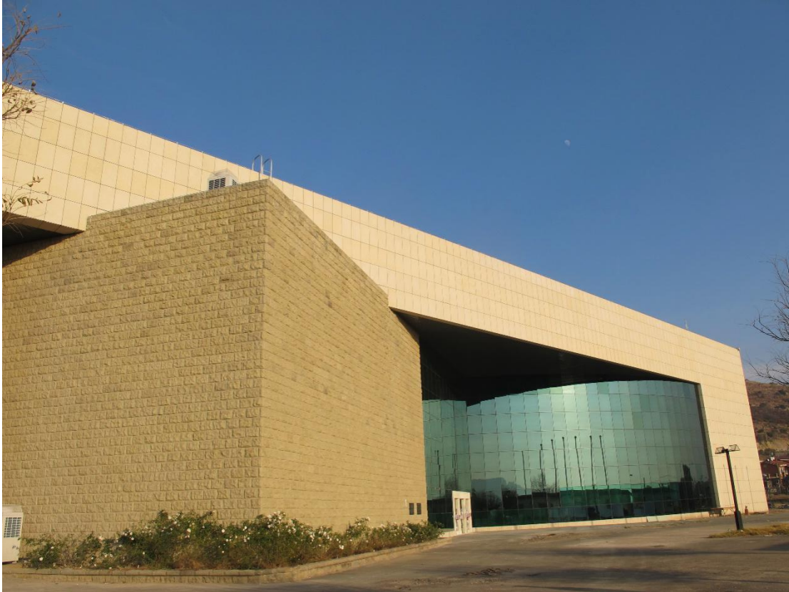
莱索托国家会议中心是该国极具现代感的地标建筑之一

莱索托王国地处非洲东南部，因其国土完全被南非环绕，故被称为“国中国”。莱索托国家会议中心是该国极具现代感的地标建筑之一，为该国提供了召开国际和地区会议的条件。今年，莱索托国家会议中心装备了全新的会议系统、同声传译系统和音频系统，该项目由易科国际北京分公司承接，选用了 Televic、EAW 和 Symetrix 等国际知名品牌产品。