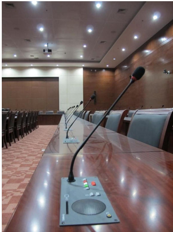
200 人会议室安装了 199 台 FD/MV5B 代表单元

此会议室同样采用 Televic Confidea 无线会议系统。该系统具备多频段传输、稳健的无线连接和安全的无线加密传输等多种功能。最重要的是，一台会议主机可携带 100 个无线单元，仅需配置一台主机扩展器即可满足客户 200 个坐席的需求。会议单元选用 Televic TCS2500 嵌入式安装面板，包括一台 FC/MV5B 主席单元和 199 台 FD/MV5B 代表单元。整套系统采用网线传输，避免信号损失。另外还配备了 Telecivic Aladdin 红外语言分析系统，构建抗干扰性极强的数字会议系统。