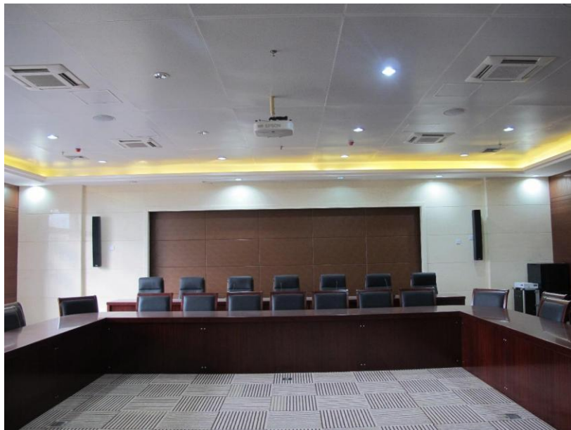
扩声系统采用 EAW LS832i 柱式音箱和 CIS400 吸顶音箱

这三间会议室皆采用 Televic Confidea 无线会议系统：每间会议室配置 5 个会议代表单元和 1 个主席单元。扩声系统则组合了 6 只 EAW LS832i 柱式音箱和 12 只吸顶安装的 EAW CIS400 全频音箱。音频处理由 Symetrix Solus4 提供。