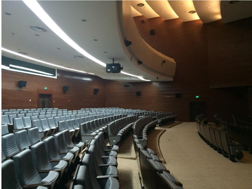
800人大会议厅其实是一个中小型剧场，含有二层挑台

为实现会议和同声传译功能，厅内配置了 Televic Confidea 会议系统，包括 5 台 Televic ID2500 同传译员设备。多通道语言分布同样使用 Aladdin 红外分布系统，600 套具备通道选择功能的红外接收器和 Televic TEL200 接收耳机用于接收会议语音信号。