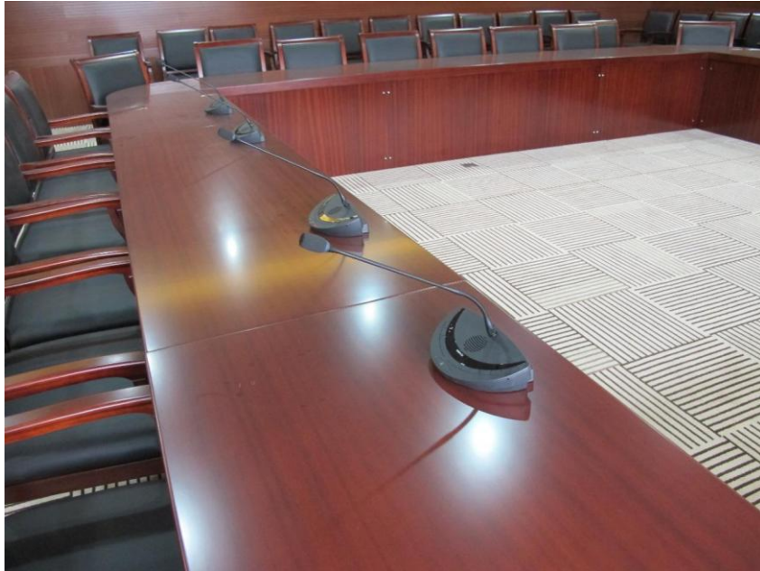
三间会议室皆采用 Televic Confidea 无线会议系统

这三间会议室皆采用 Televic Confidea 无线会议系统：每间会议室配置 5 个会议代表单元和 1 个主席单元。扩声系统则组合了 6 只 EAW LS832i 柱式音箱和 12 只吸顶安装的 EAW CIS400 全频音箱。音频处理由 Symetrix Solus4 提供。