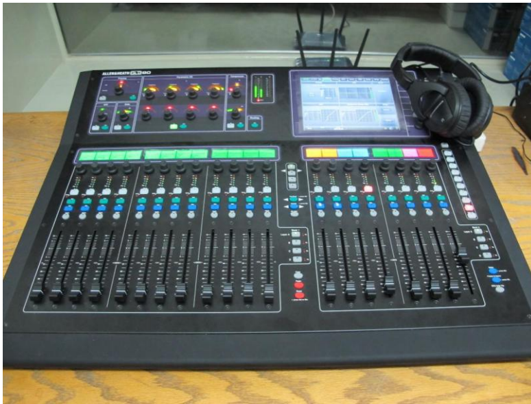
音频控制部分采用 Allen & Heath GLD80 调音台

音频控制部分采用 Allen & Heath GLD80 调音台，配合两台音频扩展机架箱 Allen & Heath AR84 和 Allen & Heath AR2412 使用，增加了系统的灵活性。处理器部分则采用一台 Symetrix Radius 12x8。