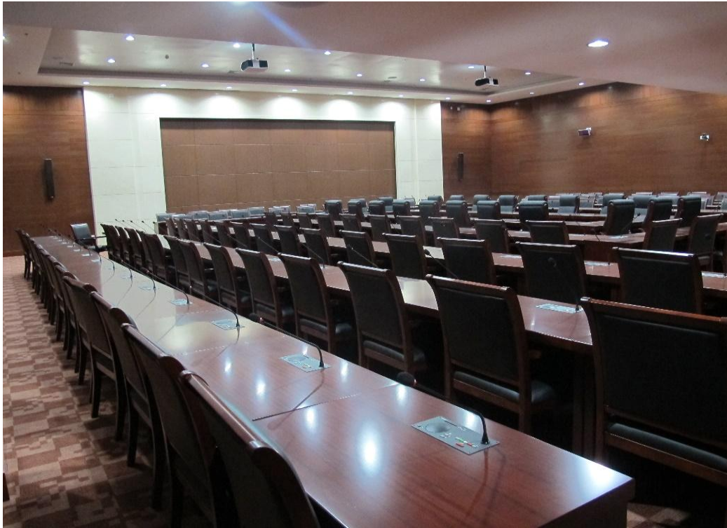
200 人会议室采用 EAW LS832i 柱式音箱加 EAW CIS400 吸顶的组合方式扩声

会议系统的扩声当然也是重点。由于会场内发言单元较多，很容易引起啸叫。鉴于此，特采用 EAW LS832i 柱式音箱加 EAW CIS400 吸顶的组合方式扩声。LS832i 柱式音箱使用精确的“发散覆盖”技术，充分发挥了线声源藕合的优势，可以有效避免啸叫并实现远距离投射。